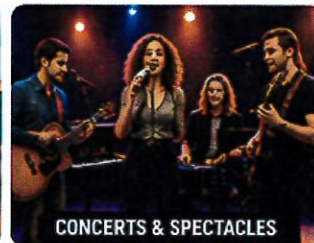
CONCERTS & SPECTACLES