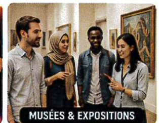
MUSÉES & EXPOSITIONS