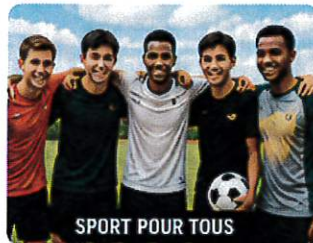
SPORT POUR TOUS

TOUTES NOS ACTIVITÉS SONT GRATUITES POUR LES USAGERS ET BÉNÉFICIAIRES SAD UBUNTU